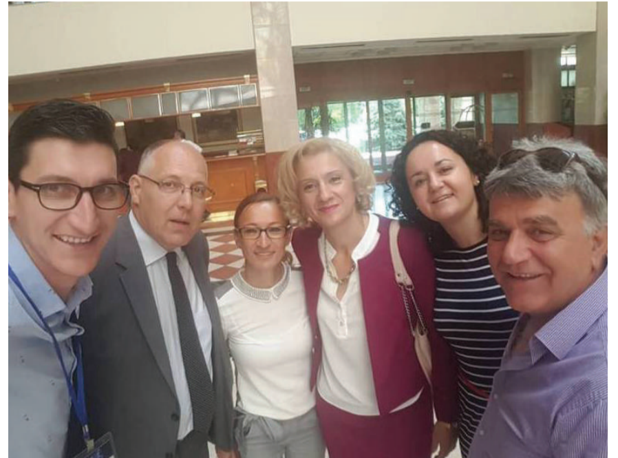
Zajednička fotografija nastavnog osoblja sa dva fakulteta